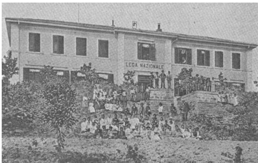
Abbildung 5. Eine Schule der Lega Nazionale in Capo d'Istria. Man sieht die Aufschrift (in Lega Nazionale s.a.).