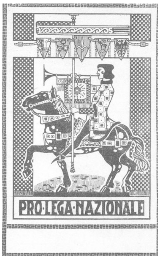
Abbildung 2. Ein Beispiel der Karten der Lega (in Salimbeni 1994).

Verbundenheit eines Teils der Bevölkerung mit der Lega, brachte auch den Spendern den Vorteil der namentlichen Nennung in der Zeitung, genügte aber noch immer nicht, um den Geldbedarf des Vereins zu decken. Eine andere, auch für die restlichen Schulvereine typische Aktivität war der Verkauf von verschiedenen Artikeln, wie etwa Zündholzschachteln, Marken und Ansichtskarten. Die Ansichtskarten wurden zum Beispiel bei besonderen Anlässen verkauft und wiesen verschiedene Arten der Gestaltung auf, von traditionellen Motiven bis zu modernem Jugendstil.