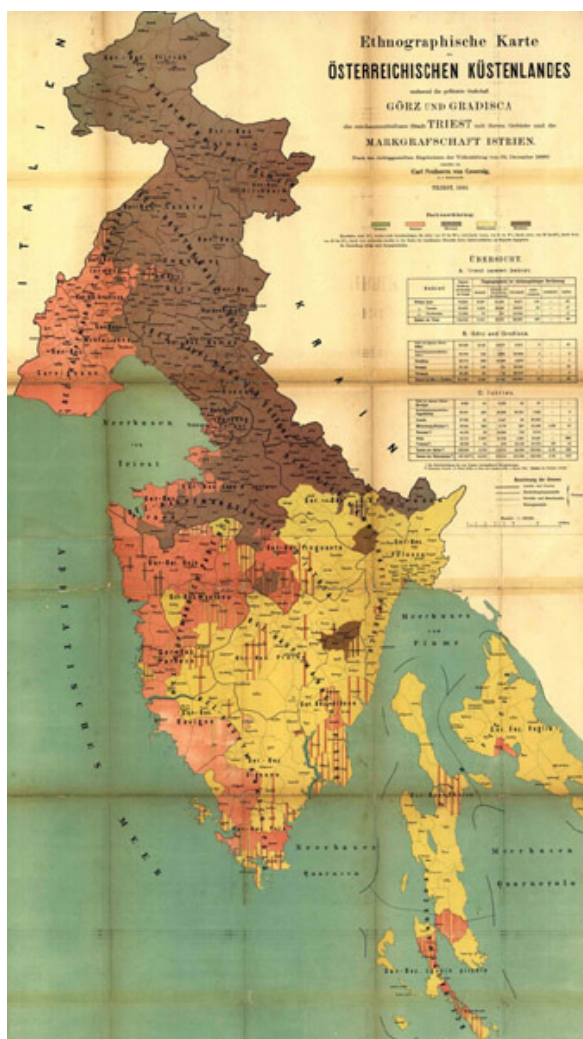
Abbildung 1. Ethnographische Karte des Küstenlandes (in Czoernig 1885).

Es sollen noch einige Werte zu den Zahlen gesagt werden. Im Jahre 1913 belief sich die Bevölkerung des Küstenlandes auf 938.000 Einwohner, davon 53 Prozent Slawen, 43 Prozent Romanen (Italiener und Friulaner) und etwas mehr als drei Prozent Deutsche. Genauere Zahlen kann man nur aus der Volkszählung von 1910 entnehmen. Damals zählte Triest 230.000 Einwohner, davon 12.000 Deutsche, 120.000 Italiener und fast 60.000 Slowenen sowie 40.000 Bürger des Königreichs Italien. In Görz und Gradisca lebten 260.000 Untertanen des Kaisers. Es stand dort eine deutsche Minderheit von 4.500 Personen 90.000 Italienern und 150.000 Slowenen gegenüber. In Istrien verteilten sich die 400.000 Einwohner auf: 170.000