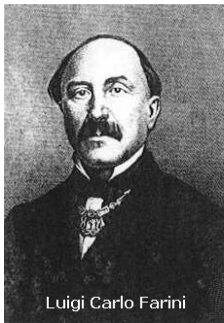
Luigi Carlo Farini

La risposta di Pio IX non si fece attendere: l'anno successivo si mise in viaggio da Roma e si recò in visita ai propri territori più settentrionali. Lo scopo del viaggio era manifesto: dimostrare l'attaccamento delle popolazioni per ribattere alle accuse e ai rimproveri che gli erano stati mossi da Parigi. Il papa percorse la via Flaminia, quindi si affacciò nelle Legazioni a Rimini, il 1° giugno 1857 e viaggiò lungo la via Emilia fino a Bologna, ricevendo accoglienze rispettose ma non particolarmente entusiastiche, secondo le cronache del tempo. Nella seconda città dello Stato rimase fino ad agosto, con una puntata a luglio a Ravenna, che era rimasta