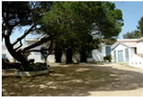
Figura 2: La “Casa di ferro”.

Da un esame dei volumi presenti nel Museo si rileva che nel corso del tempo essi sono stati sottoposti a diverse fasi di inventariazione (quasi tutti gli esemplari presentano sulle coperte etichette di piccolo formato recanti dei numeri manoscritti e ulteriori numerazioni con matite rosse e blu sui frontespizi) ma, nella maggior parte dei casi, gli inventari corrispondenti non sono oggi reperibili, sicchè una stima del nucleo originario dei libri appartenuti a Garibaldi non è più possibile.