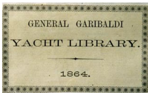
Figura 1: Ex libris di Garibaldi presente nei volumi destinati al panfilo “Princess Olga”.

era premurato di inviare alla Biblioteca Vittorio Emanuele di Roma alcuni cimeli conservati nella “casa museo”, “per la migliore conservazione dei medesimi”. Tra questi figuravano anche “due casse di carte topografiche marittime e militari [...]”;