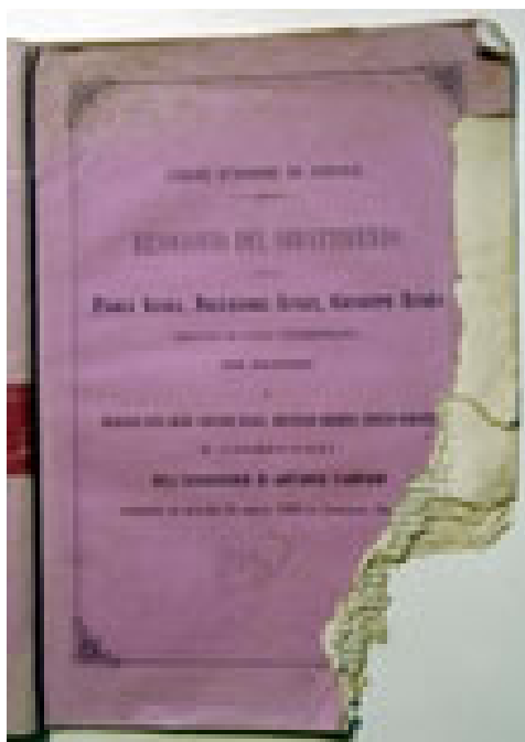
Figura 5: Uno dei tanti volumi intaccati da interventi di roditori.

Separati i libri appartenuti a Giuseppe Garibaldi da quelli di proprietà dei discendenti, è ora chiaro che Clelia ha donato e poi venduto alla Labronica gli esemplari più significativi e di maggior pregio della biblioteca paterna: a Caprera restano soprattutto libri in brossura, gli Atti Parlamentari ed una grandissima quantità, circa il 70% dei titoli, di opuscoli di vario argomento, che presentano un notevole interesse come testimonianza della circolazione delle idee nell'ambiente pre e post-unitario 14 . A differenza del fondo conservato a Livorno, che nel corso degli anni è stato consultato da diversi lettori, per cui non è possibile stabilire se evidenziazioni o aperture di pagine intonse o segnalibri siano originali, quello di Caprera può dirsi quasi interamente rispondente allo stato in cui si trovava quando Garibaldi