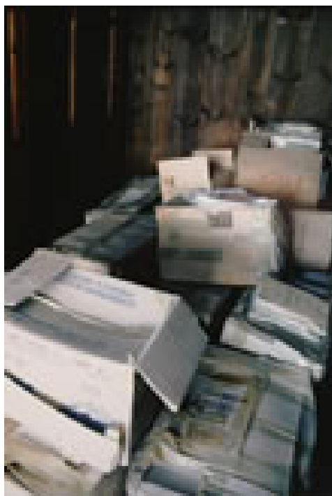
Figura 4: Situazione in cui si trovavano i volumi appartenuti a Garibaldi, prima dell'inizio dell'intervento di recupero del 1999.

Dal maggio del 1999 si sta procedendo al recupero dei 2.700 esemplari superstiti – libri, riviste ed opuscoli – che giacevano in casse di cartone all'interno della cosiddetta “Casa di ferro”, con seri pericoli di degrado per il loro stato di conservazione: la maggior parte degli esemplari era già stata intaccata da roditori e presentava un notevole deterioramento dovuto all'alto tasso di umidità a cui erano stati sottoposti nel corso degli ultimi venti anni 13 .