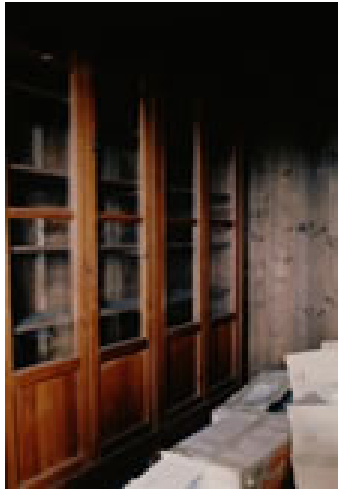
Figura 3: Interno del locale adibito a biblioteca nella “Casa di ferro”.

“Il Generale Giuseppe Garibaldi non ha mai posseduto una biblioteca e questo lo dice anche l’unica figlia ancora vivente – così il 29 luglio 1951 risponde Calaresu al Ministero della Pubblica Istruzione –. I suoi libri li teneva sparsi un po’ dappertutto e quando morì la famiglia li conservò in Museo assieme agli altri cimeli. Non contengono autografi né annotazioni di nessun genere”: per cui, conclude laconico il sovrintendente, “si omette la compilazione e l’invio a codesto Ministero dei prospetti” richiesti.